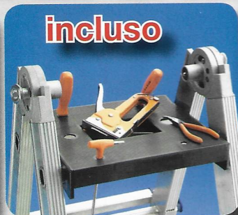
Pianetto portattrezzi in dotazione