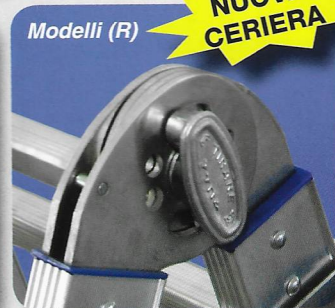
Cerniera lamellare in alluminio per i modelli più alti - garantita 10 anni