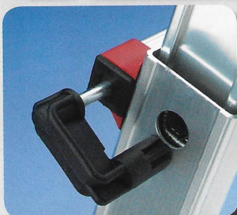
Ganci in acciaio ricoperti in nylon