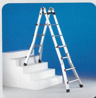
Zoppa su scale